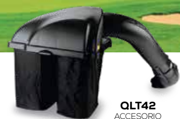
QLT42 ACCESORIO RECOLECTOR DE PASTO DE 2 BOTES