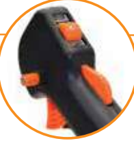
MANUBRIO CUERNOS SUJECIÓN PARA CORTE HORIZONTAL Y VERTICAL