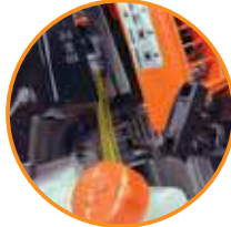
MOTOR 4 TIEMPOS MÁXIMA EFICIENCIA Y DURABILIDAD