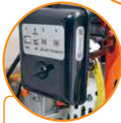
PRESURIZADOR DE LÍQUIDO INCLUIDO.