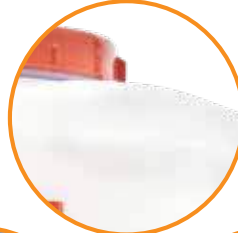
TANQUE PARA POLVO O LÍQUIDO DE 20 LITROS.