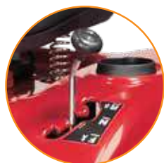
7 VELOCIDADES SHIFT ON THE GO