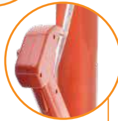
CAÑÓN EXTRA LARGO PARA UN MAYOR ALCANCE DE ROCÍO.