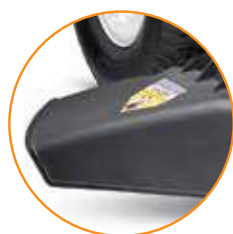
DESCARGA LATERAL O PICADOR