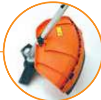
CABEZAL PROFESIONAL USO RUDO