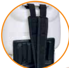
ARNÉS CÓMODO PARA SOPORTAR EL PESO.