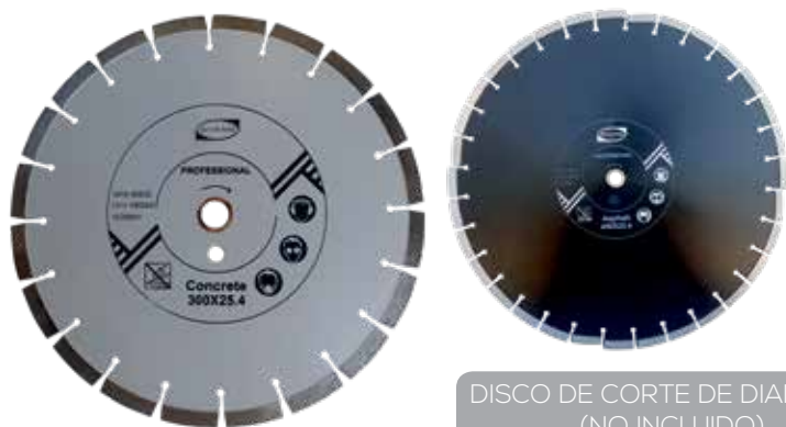
DISCO DE CORTE DE DIAMANTE (NO INCLUIDO)