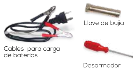
Llave de buja