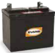
BATERÍA 12 V.

MODELO RBJ-AC906LM PARA GENERADORES PORTÁTILES