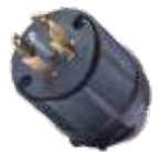
CLAVIJA DE SEGURIDAD.

Con seguro girar-trabar (TWIST LOCK) 3P. 4H. 125/250 V, 30 A Código RG-CNL14-30P