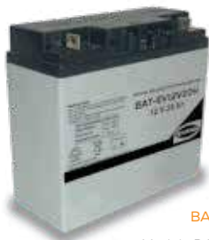
BATERÍA 12 V.

Modelo BAT-EV12V20H para Generadores Portátiles